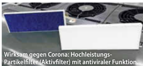
Wirksam gegen Corona: Hochleistungs-Partikelfilter (Aktivfilter) mit antiviraler Funktion

Neu sind serienmäßige Hochleistungs-Partikelfilter mit antiviraler Wirkung (sog. Aktivfilter). Die antiviralen Funktionsschichten filtern feinste Aerosole.